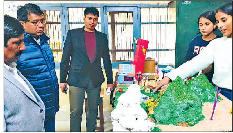
बहादुरगढ़। प्रदर्शनी का अवलोकन करते प्राचार्य व अन्य शिक्षक।