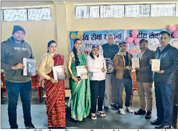
झज्जर। मुख्यातिथि और महाविद्यालय स्टॉफ सदस्यों के साथ होनहार स्वयंसेवक।

राजकीय स्नातकोत्तर नेहरू महाविद्यालय की एनएसएस इकाई एक एंव दो के तत्वावधान में आयोजित सात दिवसीय विशेष शिविर का बुधवार को समापन हुआ। शिविर के दौरान स्वयंसेवकों ने श्रमदान, जागरूकता अभियानों, स्वच्छता गतिविधियों तथा सामाजिक विषयों पर आयोजित