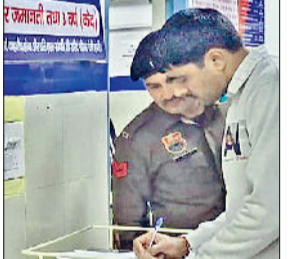
झज्जर। नागरिक अस्पताल परिसर में पोस्टमार्टम के लिए कागजी कार्रवाई करते हुए पुलिसकर्मी।

■ गांव मारौत में मोटर खराब होने पर ठीक करने के लिए रस्से के सहारे उतर रहा था 21 वर्षीय युवक, पुलिस ने इतफाकिया कार्रवाई की