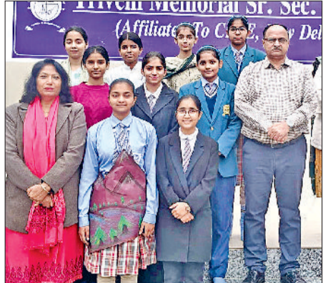
बहादुरगढ़। कार्यक्रम में शिक्षकों के साथ विद्यार्थी।

भड़काने का प्रयास न करें। पंचायत में उपस्थित प्रतिनिधियों ने कहा कि एसआईटी की रिपोर्ट आने तक सब्र रखना ही उचित कदम है और इस मामले में कानून के दायरे में रहकर ही समाधान निकाला जाएगा।