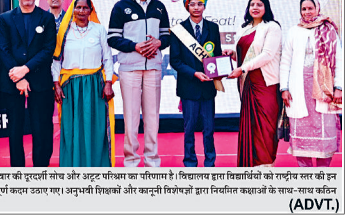
सफल विद्यार्थियों ने कहा कि यह सफलता आरपीएस परिवार की दूरदर्शी सोच और अटूट परिश्रम का परिणाम है। विद्यालय द्वारा विद्यार्थियों को राष्ट्रीय स्तर की इन प्रतियोगी परीक्षाओं के लिए तैयार करने के लिए कई महत्वपूर्ण कदम उठाए गए। अनुभवी शिक्षकों और कानूनी विशेषज्ञों द्वारा नियमित कक्षाओं के साथ-साथ कठिन विषयों पर विशेष सत्र आयोजित किए गए। (ADVT.)