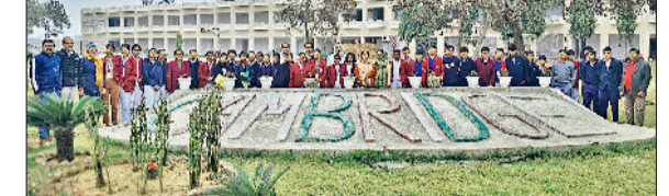
झज्जर। ट्यूनिंग प्रोग्राम में शामिल विद्यार्थी एवं शिक्षक।